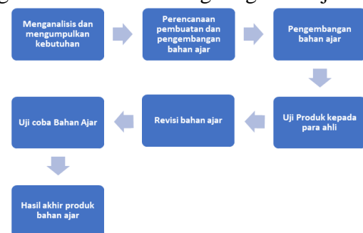
Gambar 1. Pembuatan Bahan Ajar BIPA

Secara umum, dalam bahan ajar BIPA terdapat beberapa komponen yang harus ada yaitu pembelajaran adalah informasi umum, komponen inti, lampiran dan hal lain yang dapat digunakan menyesuaikan kebutuhan suatu mata pelajaran. Isi dari bahan pembelajaran diantaranya tujuan dari pembelajaran, langkah dalam pembelajaran, asesmen untuk siswa, informasi yang dibutuhkan siswa, serta referensi pembelajaran yang membantu guru dalam pembelajaran. Pada bahan ajar kurikulum merdeka, guru memiliki hak dalam mengembangkan komponen-komponen bahan ajar agar sesuai dengan kebutuhan dan lingkungan belajar.