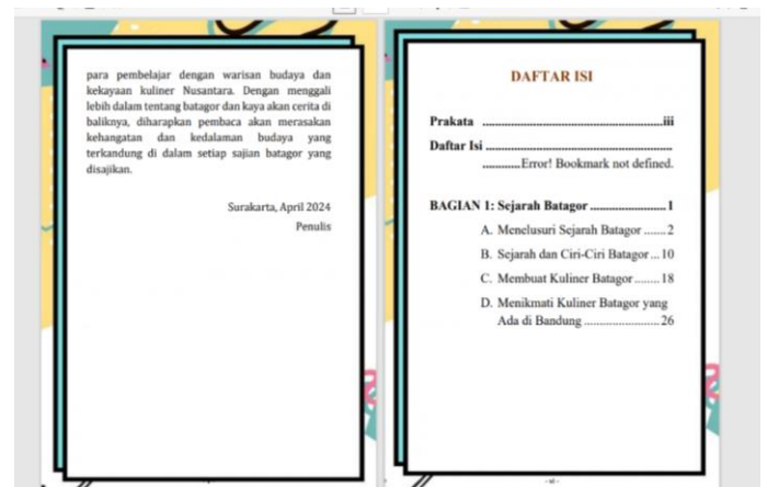
Gambar 4. Daftar isi Bahan Ajar

Pada kegiatan pertama ialah mendefinisikan serta memfokuskan tujuan pembelajaran dengan jelas dalam merancang bahan ajar. Tujuan-tujuan ini harus sejalan dengan kriteria tujuan pembelajaran yang dapat dicapai oleh pembelajar BIPA, Menurut (Purwati, D., & Suhirman, S., 2017). Tahapan awal mendesain bahan ajar menentukan draf yang terdiri dari judul, kompetensi, sub kompetensi, tujuan, materi, prosedur, soal-soal, dan evaluasi. Dan Bahan ajar BIPA harus memenuhi 4 Kriteria berbahasa.