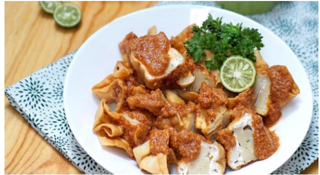
Gambar 2. Batagor

Budaya kuliner suatu daerah merupakan komponen penting dari kekayaan budaya secara keseluruhan. Indonesia sebagai sebuah negara dengan kekayaan adat istiadat serta keanekaragaman budayanya menawarkan berbagai macam kuliner lezat yang menggugah selera dan memancing rasa lapar yaitu batagor, atau bakso tahu goreng, adalah salah satunya dan merupakan makanan ringan yang umum di Indonesia, terutama di Jawa Barat. Menurut (Runtiko & Agus Ganjar, 2020) batagor adalah singkatan dari bakso, tahu, dan goreng. Batagor dianggap sebagai hidangan nasional Jawa Barat. Menyantap batagor merupakan kenikmatan tersendiri karena memiliki rasa gurih, serta bumbu kacangnya yang pedas. Batagor memiliki sejarah panjang dalam menggabungkan pengaruh budaya yang berbeda sebagai bagian dari kuliner nusantara.