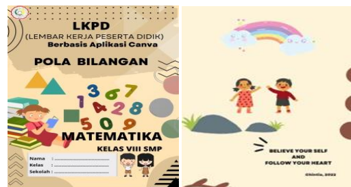
Gambar 1. Halaman depan dan belakang LKPD

gambar atau animasi yang sesuai dengan materi, dan lainnya. Setelah proses pembuatan LKPD selesai, bisa langsung diunduh untuk ditampilkan secara offline dalam bentuk gambar, atau pada bagian unduh akan muncul link hasil desain yang dapat disalin atau dibagikan. Berikut adalah hasil produk LKPD. Penelitian oleh Faiza (2019) menunjukkan bahwa Canva efektif dalam pembuatan media pembelajaran karena menyediakan fitur yang intuitif dan fleksibel. Dalam konteks penelitian ini, Canva membantu peneliti merancang LKPD yang lebih menarik dan sesuai dengan preferensi visual siswa.