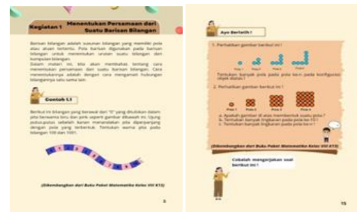
Gambar 3. Halaman soal dan uji kompetensi LKPD