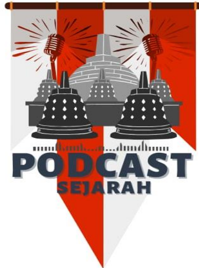
Gambar 1. Tampilan Cover Podcast

selanjutnya dirilis ke aplikasi Spotify . Namun sebelum itu, beberapa episode diuji coba dengan audiens terbatas untuk mendapatkan masukan awal mengenai konsep, penyampaian, maupun kualitas audio.